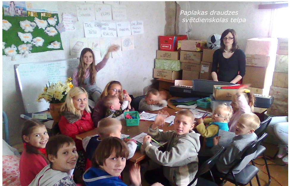
Paplakas draudzes svētdienu skolas telpa

Neskatoties uz to, mēs esam ticības un apņēmības pilni, ka Dievs savus bērnus nelaimē neatstās un noteikti kāds risinājums šajā sarežģītajā situācijā tiks atrasts. Jūsu palīdzība tam ir brīnišķīgs apliecinājums!