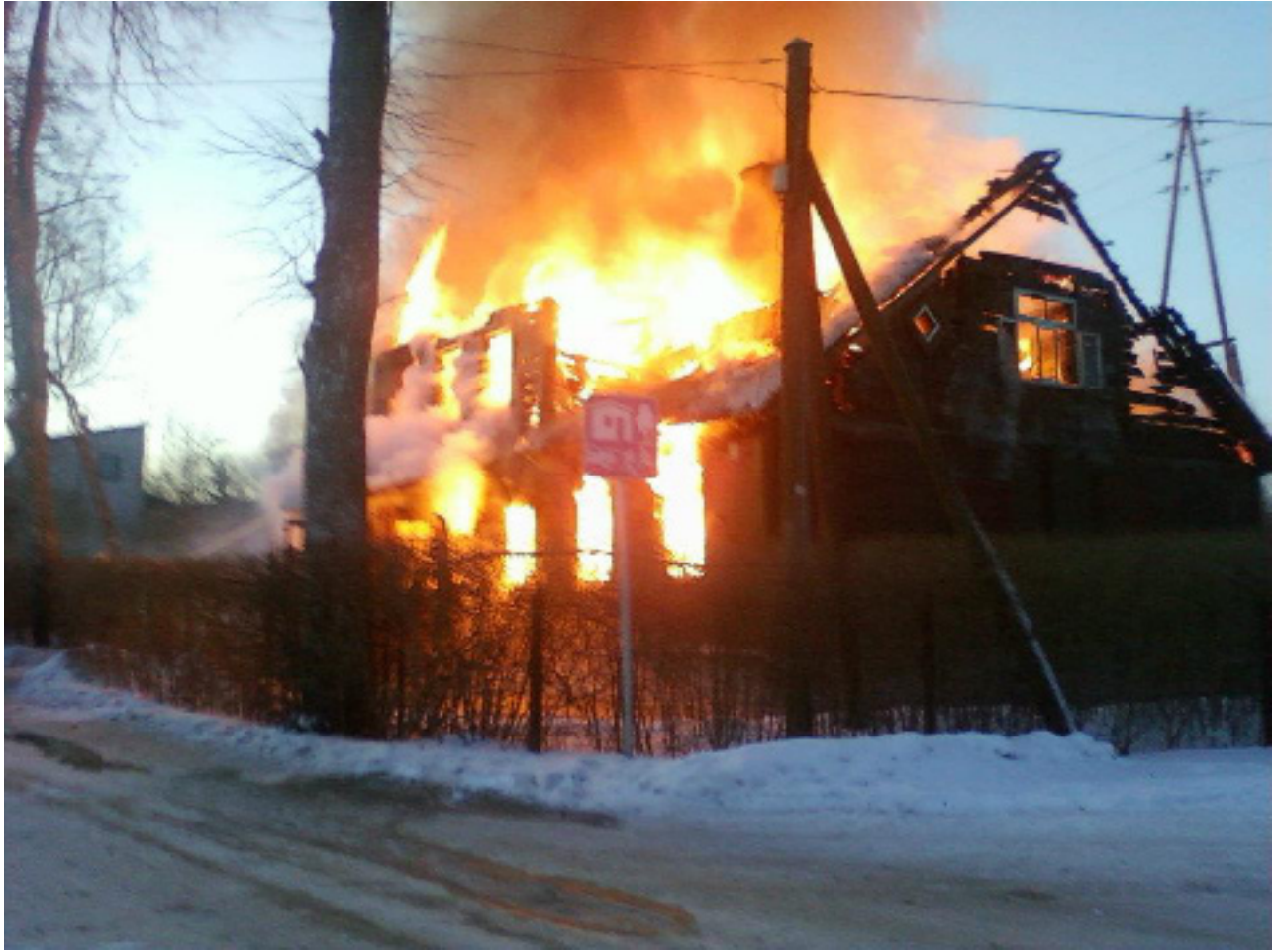
2012. g. 10. februārī deg Viesītes baptistu baznīca